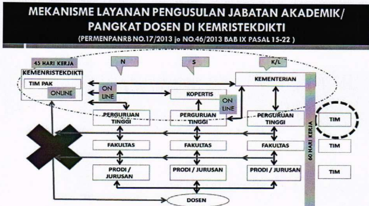
Gambar 1. Mekanisme Layanan Pengusulan Jabatan Akademik/Pangkat Dosen

Kenaikan jabatan akademik/pangkat dosen merupakan bagian tidak terpisahkan dengan pengembangan karir dosen, dengan demikian mekanisme penilaian dan proses kenaikan jabatan akademik/pangkat dosen akan diintegrasikan secara online (daring). Dengan sistem daring diharapkan dapat meningkatkan efisiensi layanan dan mendukung prinsip-prinsip penilaian, sebagaimana pada Gambar 1.